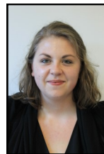
Door Lauwers LAD Nederlands